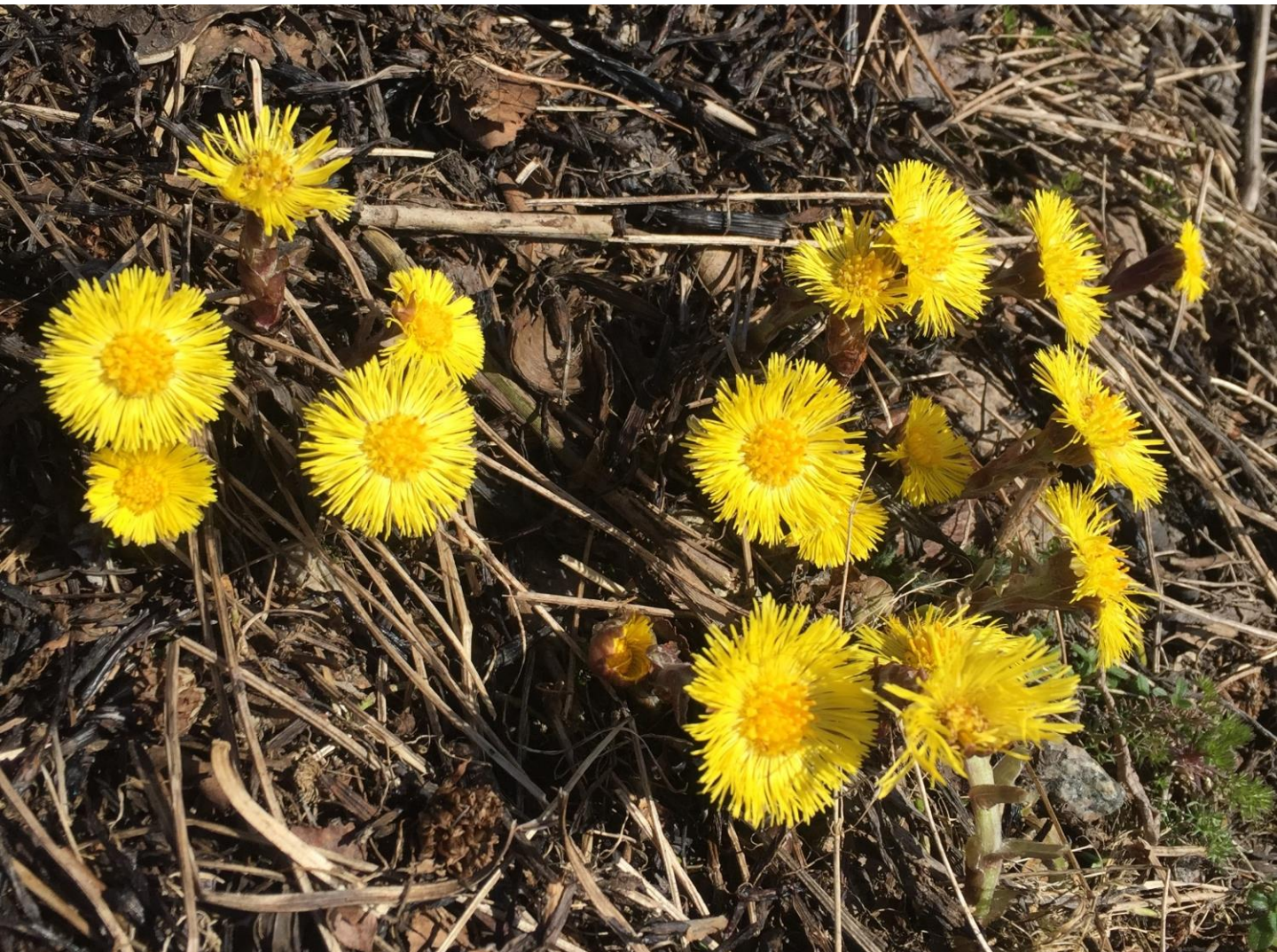
Blommande hästhov.